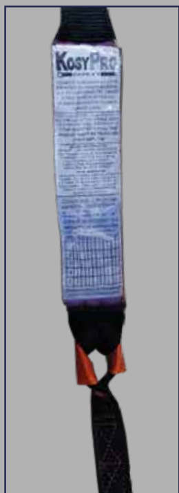
VISTA INTERIOR DEL AMORTIGUADOR Y CABEZA DE LÍNEA

ESTE EQUIPO ES DE PROTECCIÓN PERSONAL, SU USO ES INDIVIDUAL. DEBE USARSE UNIDO A UN ARNÉS DE CUERPO COMPLETO