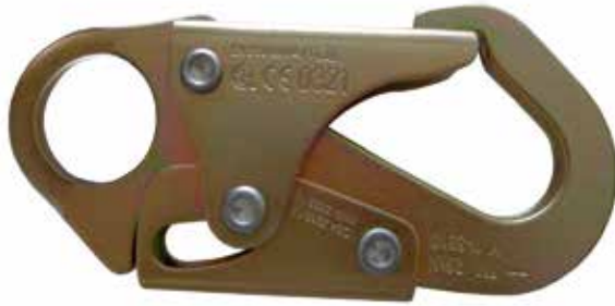
GANCHO PEQUEÑO DE 3/4" DE APERTURA DE COMPUERTA, RESISTENCIA DE COMPUERTA DE 3600 lbs