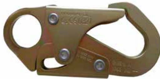
GANCHO PEQUEÑO DE 3/4" DE APERTURA DE COMPUERTA, RESISTENCIA DE COMPUERTA DE 3600 lbs

Absorbedor de Impacto de 6 pies = 1.80m Conexión a la altura de la cabeza