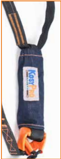
CAPUCHON PROTECTOR DE AMORTIGUADOR

LÍNEA DE VIDA Y CONEXIÓN CON ABSORBEDOR DE IMPACTO DE 1.80m LÍNEA DOBLE CON GANCHOS DE 2 1/2"